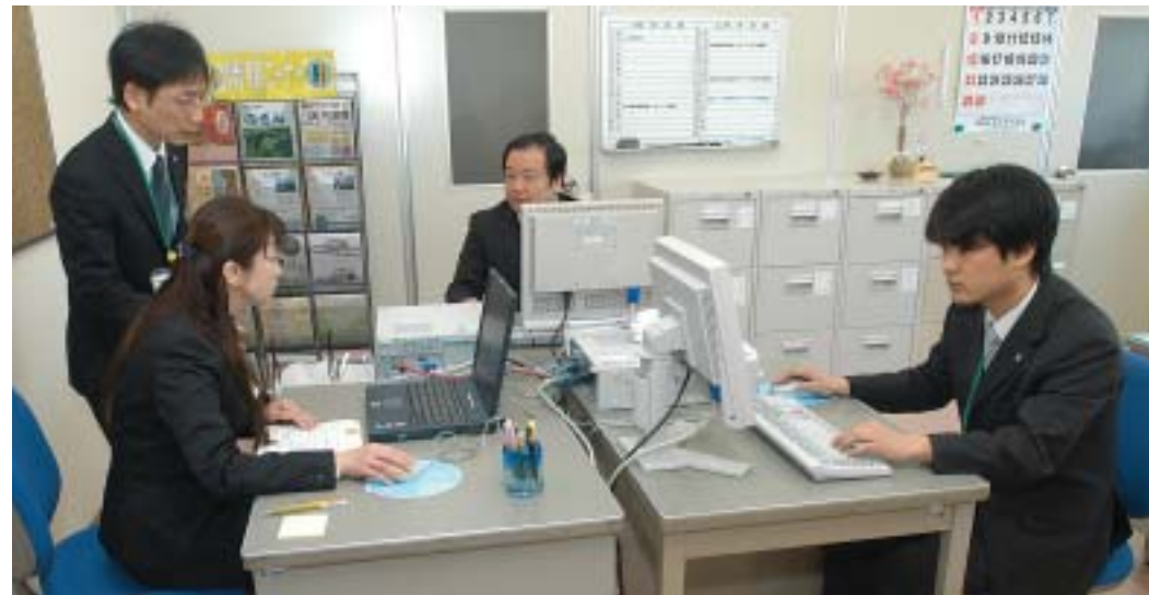
総合福祉センター1階に開所した障がい者千人雇用センターの事務室