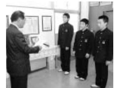
わかば賞の表彰式

総 社中学校野球部は10月20日に「岡山県わかば賞」をいただき、これを励みに、地域への貢献と野球に熱心に取り組んでいくと心新たにしました。 7月に開かれた西部地区ふれあい球技大会のソフトボールの部に参加し、大会を盛り上げ、地域の人に元気を与えたということでの受賞です。大会では、大きな声を出し、元気いっ