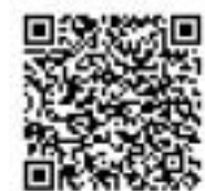
市図書館の携帯サイトのQRコード

ホームページのリニューアルにより、市図書館のトップページのアドレスが http://www.city.soja.okayama.jp/tosyokan_top.jsp