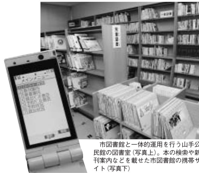
市図書館と一体的運用を行う山手公民館の図書室(写真上)。本の検索や新刊案内などを載せた市図書館の携帯サイト(写真下)

理し、購入したり市図書館から移したりした約700冊を加えた約5200冊。今後も、本の追加を行っていきます。