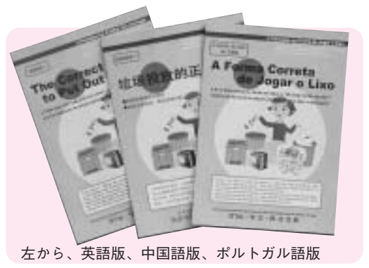
左から、英語版、中国語版、ポルトガル語版

市内に在住の外国人向けに英語版、中国語版、ポルトガル語版の3種類の『ごみの正しい出し方』を作成しました。 9月末現在の外国人世帯主に配付したほか、転入手続きのときにも配布しています。アパート経営者や町内会などで必要な場合は環境課までご連絡ください。 問い合わせ 環境課ごみ対策係 (☎028338)