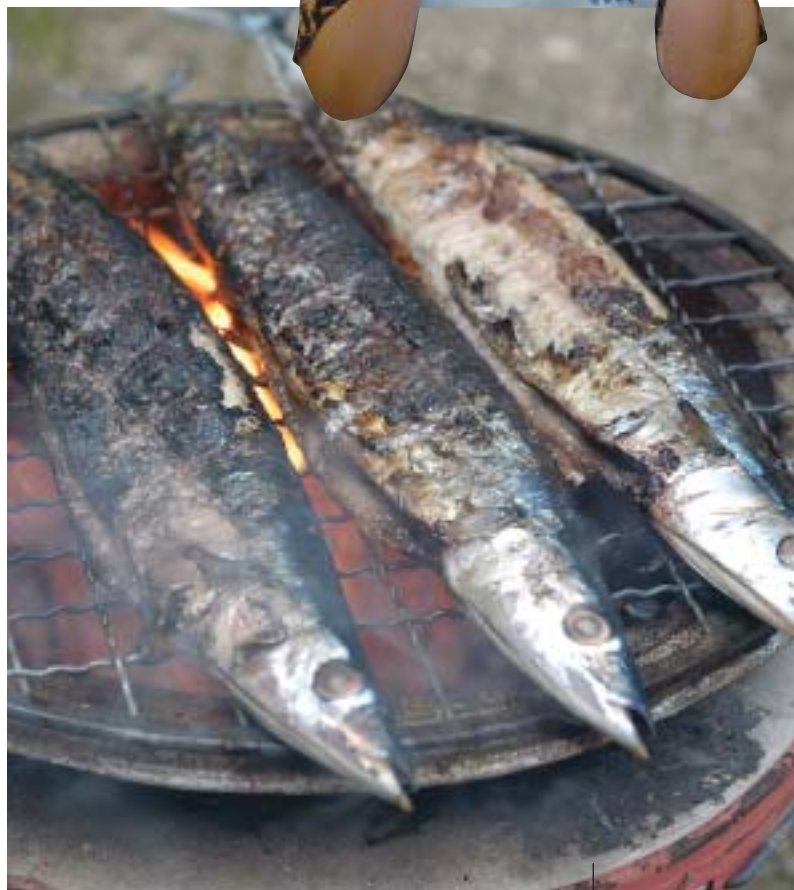
サンマを七輪で焼く。サンマを漢字で書くと「秋刀魚」になるように秋の魚だ。焼くときに出るあのにおいは食欲をそそる