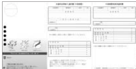
口座振替を利用している場合の通知書。中央の面には、これから納める料金や使用料などが印字され、右端の面には、前回の口座振替の内容が印字される