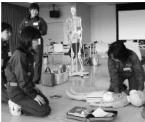
救急救命の講習会に向けて、AEDを使った訓練をしている女性消防団員。消防署の救急救命士とつとに地域の講習会に出向き、AEDの使い方の実演などでも活躍している

採用時期 平成21年4月1日(予定) 応募方法 消防本部庶務課に備え付けの女性消防団員採用申込書に必要事項を記入し、持参、または郵送で提出