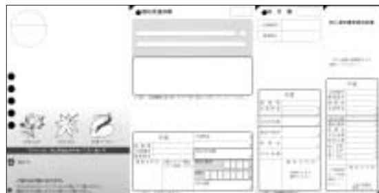
金融機関の窓口で水道料金や下水道使用料などを納める場合の通知書。右端の部分が、納付書と領収証書。はがきを開いたら、切らずに、写真の状態のまま金融機関の窓口まで持参し、納付

検針時に渡される「水道等使用水量のお知らせ」(レシートのようなもの)にも、翌月に請求のある水道料金と下水道使用料(または農業集落排水処理施設使用料)の見込み額を表示します。