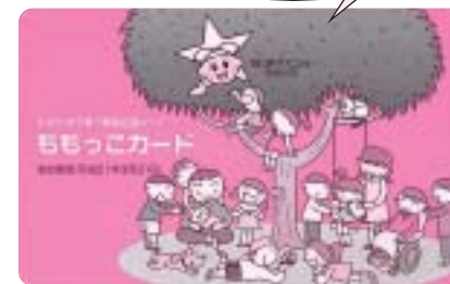
子育てを応援しようと、岡山県が作った「ももっこカード」