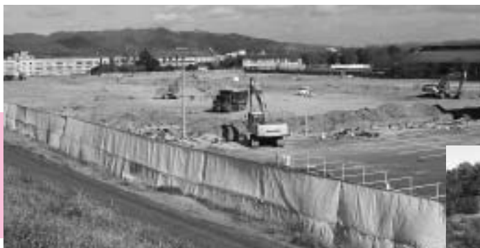
大阪富士工業が進出する中原地内の土地（8号に関連記事）。新たな雇用の創出につながる