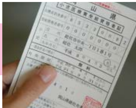
小児医療費の無料化の対象を小学6年生までに引き上げる。手続き方法は、『広報そうじゃ』2月号で