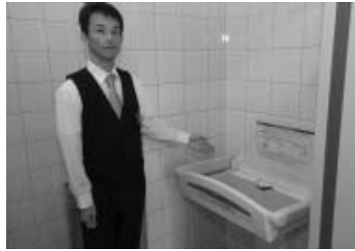
サンロード吉備路の多目的トイレにあるおむつ台

～マップの名前も募集中～ 市では、「まちの子育てバリアフリーマップ(地図)」を制作中です。この地図には、「ベビーカーといっしょに入りやすいトイレをはじめ、子ども用便器、おむつの交換台、授乳室、備え付けのベビーベッド、託児室や遊べるスペース、分煙、こども用イスやエレベーターがあることなどの情報を、施設ごとに掲載します。 乳幼児といっしょの外出や日常の買い物などの際に、このマップを使っていたらどうかと考えています。そのため、掲載する施設は公共施設に限らず、量販店や商店、スーパー、飲食店、娯楽施設、公園、金融機関などの施設も含みます。 そこで、皆さんの実体験に基づく情報を募集いたします。また、あわせて、この地図につける愛らしい名前も募集しています。 情報提供・応募方法 ハガキかEメールでこども課子育て支援係あてに送る(〒719-1192 中央二丁目1番1号、kodomo@city-soja.okayama.jp) 地図の発行は来年の3月の予定です。