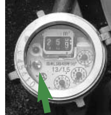
家の中の蛇口をすべて閉めているのに、このパイロットマークが回っているときは、どこかで水が出ています。

なお、調査や修理の費用は、使用者・所有者負担です。 問い合わせ 上水道課業務係 (☎②8326)