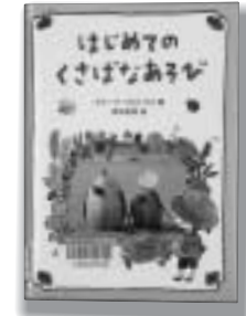
ブルーP・コロムブス・著 のら書店

木や草、野菜、花など自然の素材をつかってあそんでみましょう。目で見て、耳で聞いて、においをかいで、さわって、味わって…。春夏秋冬と、季節ごとの草花あそびを、イラストや写真でたくさん紹介します。