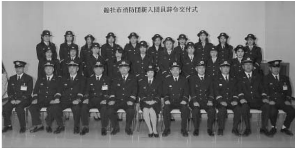
総社市消防団新入団員辞令交付式