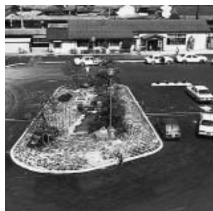
昭和49年3月当時の駅前広場

また、駅を利用する人の安全面にも配慮されています。人と車の流れが交差しないよう、歩道と車道は完全に分離され、段差のない、ゆつたりとした歩道が整備されています。高齢者や身体障害者にも優しい広場となりました。これで、10月と11月に開催される「晴れの国おかやま国