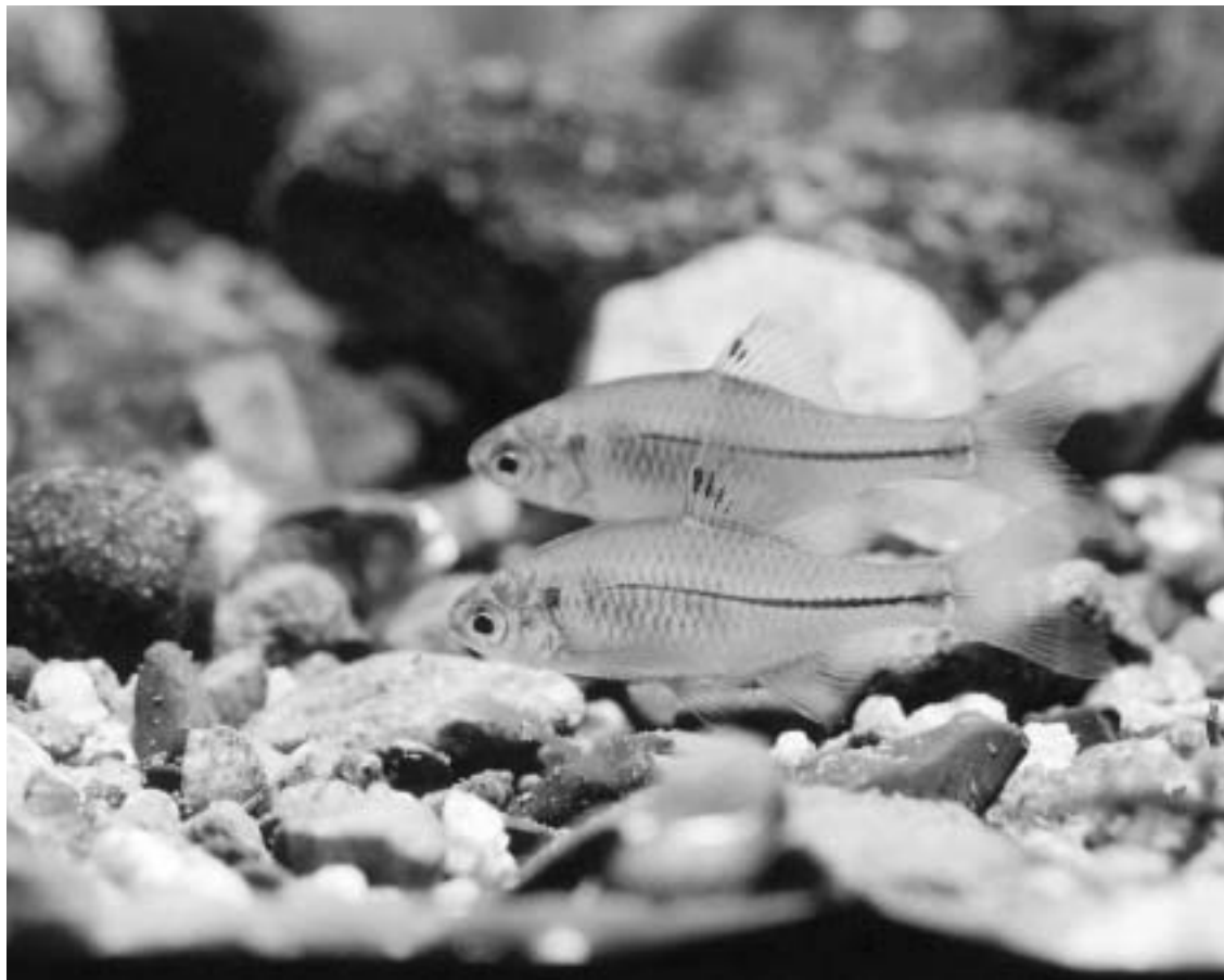
スイゲンゼニタナゴ