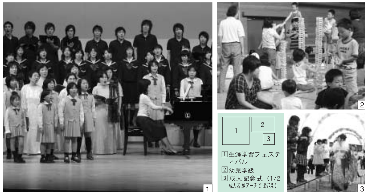
1 生涯学習フェスティバル 2 幼児学級 3 成人記念式(1/2 成人者がアーチで出迎え)