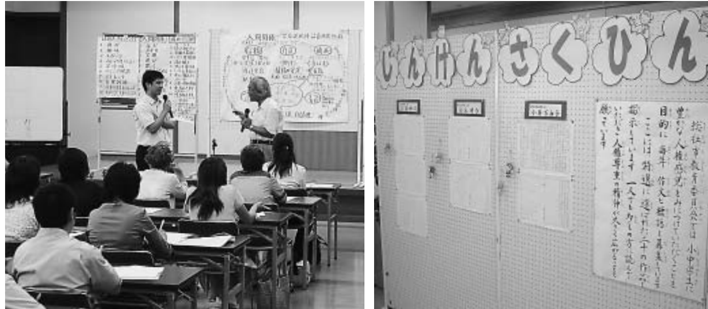
人権教育指導者育成講座(左) 人権作品展(右)