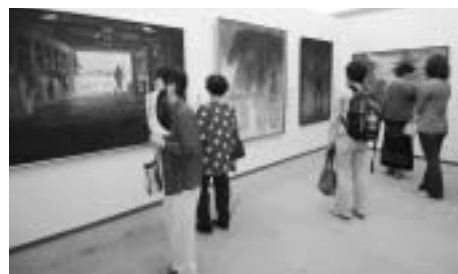
墨彩画公募入選作品展

雪舟の里総社 墨彩画公募入選作品展の開催 総社市文学選奨（詩、短歌、俳句、川柳、小説、童話） サマーミュージックフェスタの開催 国民文化祭に向けた取り組み