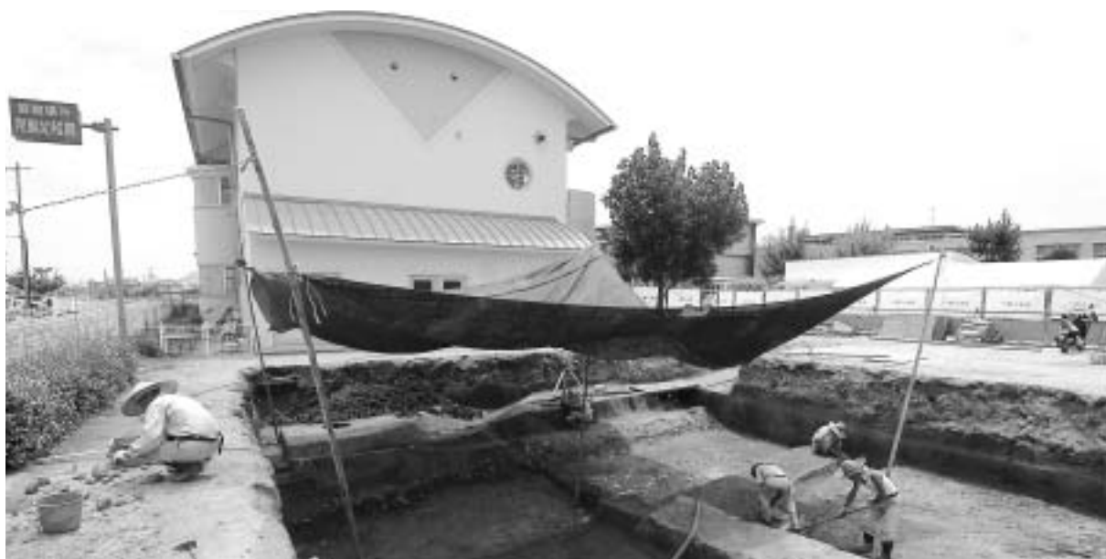
常盤幼稚園舎増築に向けて行われている埋蔵文化財発掘調査