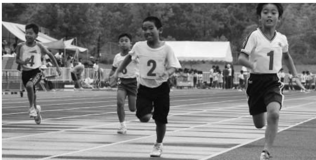
市民総合スポーツ祭