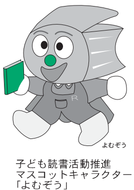
子ども読書活動推進 マスコットキャラクター 「よむぞう」