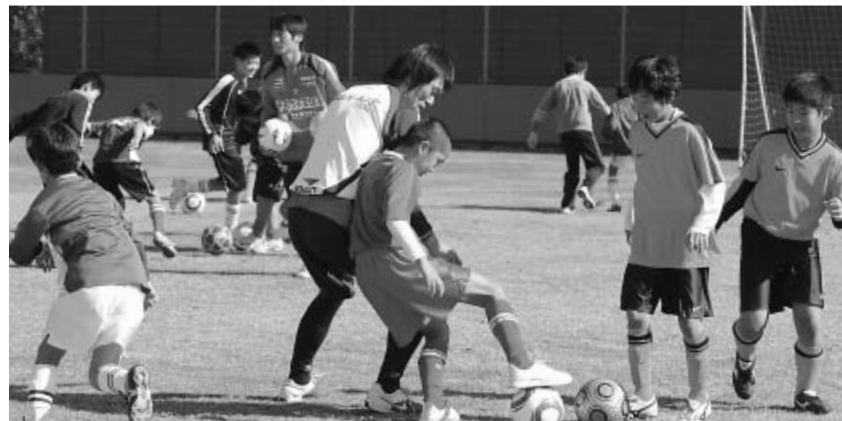
わくわくフェスティバル