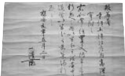
県指定となった宝福寺文書の一つ