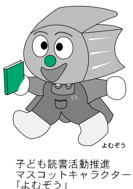
子ども読書活動推進 マスコットキャラクター 「よむぞう」