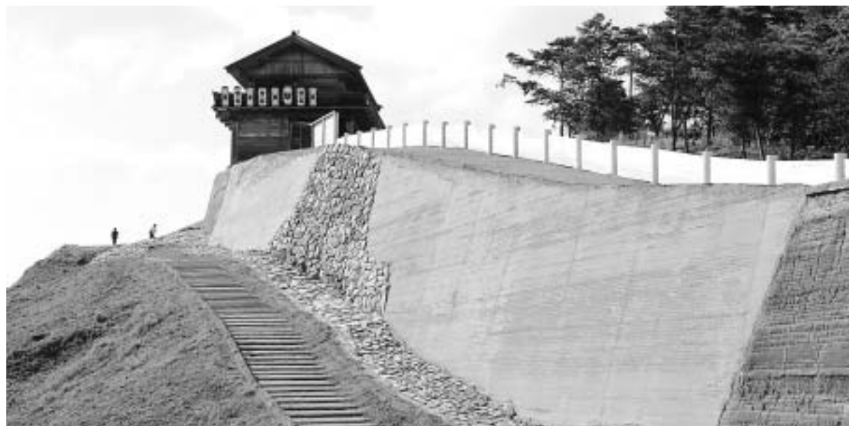
鬼ノ城の西門から第0水門付近。10年の歳月を経て門や角楼、土塁やその上部の板塀、敷石、遊歩道が完成した