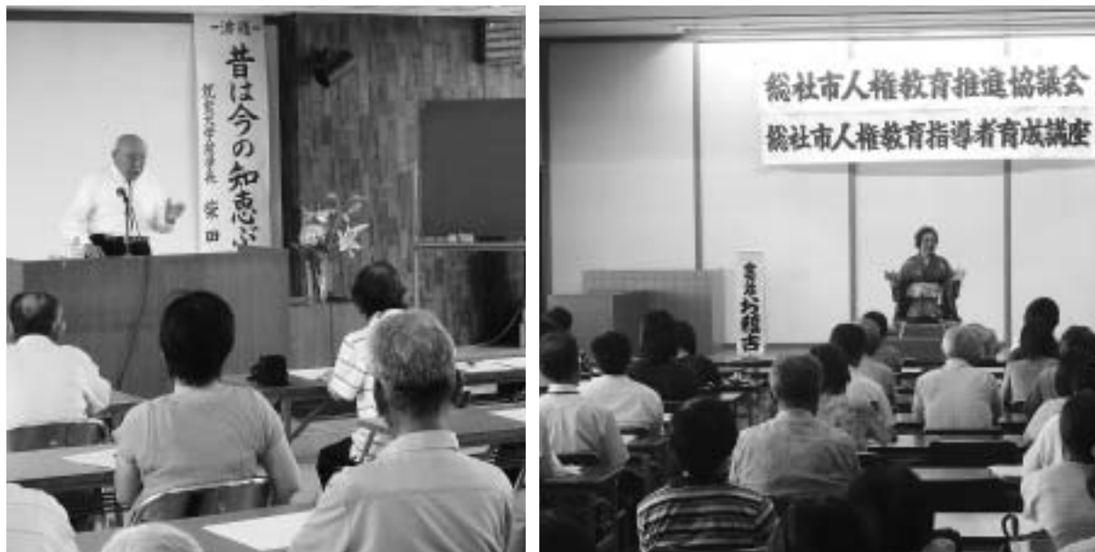
巡回ふれあい講演会(左)、人権教育指導者育成講座(右)