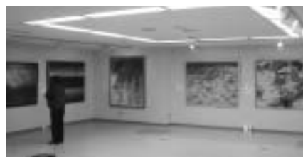
墨彩画公募展上位入賞作品展

平成12年度に策定した「史跡鬼城山（鬼ノ城）環境整備基本計画」では、鬼城山保存整備計画の基本理念を、総社市を代表する自然と歴史と文化の核的空間づくりを行うものとした。そして、「豊かな自然のなかに蘇 よみが える古代山城－鬼ノ城 歴史と自然の野外博物館－」をめざす。また、整備にあたっては遺跡の保存を第一とし、来訪者の古代山城理解を深めるための整備に努める。