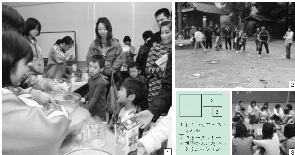
① わくわくフェスティバル ② ウォークラリー ③ 親子のふれあいレクリエーション