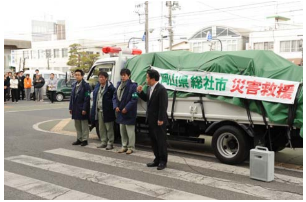
第2便 3月16日 (岩手県釜石市, 大槌町)