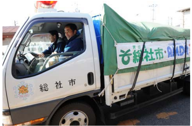
第11便 3月26日 (宮城県多賀城市)