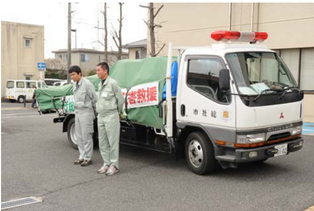
第8便 3月23日 (宮城県多賀城市)