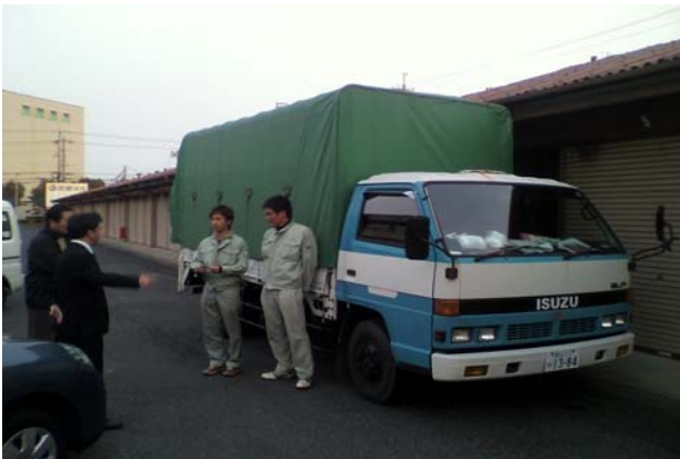
第5便 3月19日 (宮城県多賀城市)