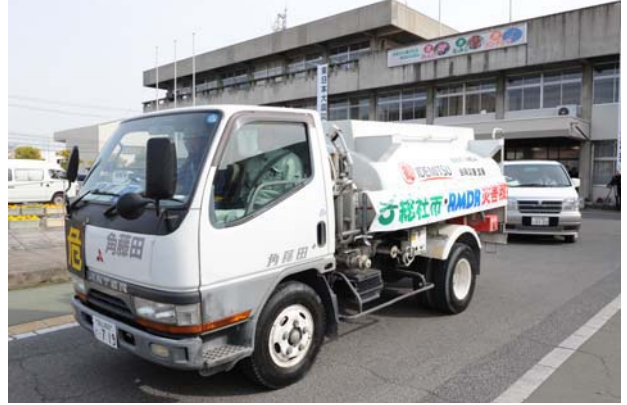
第4便 3月18日 (岩手県釜石市, 大槌町)