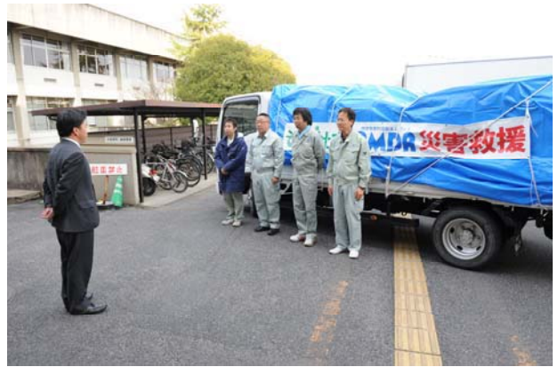
第6,7便 3月22日 (福島県いわき市, 伊達市)