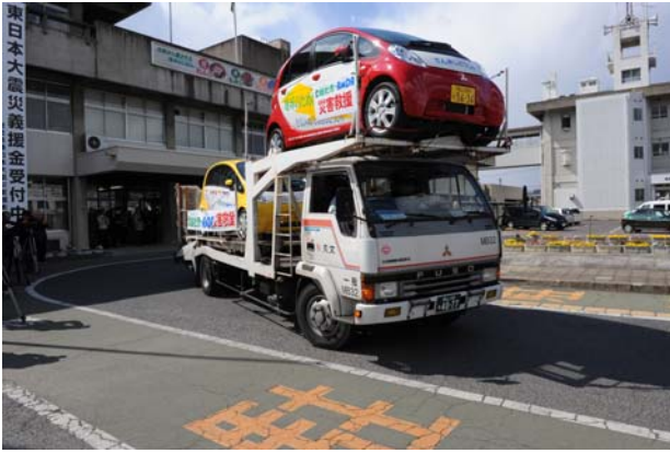
第1便 3月16日 (岩手県釜石市)