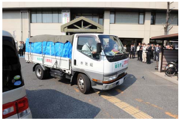
第12便 3月28日 (岩手県大槌町)