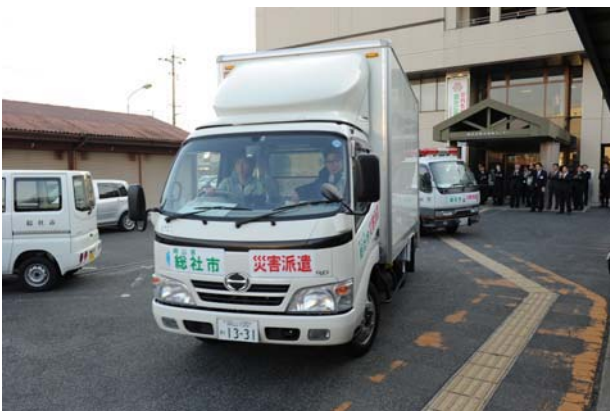
第13,14便 4月1日 (福島県南相馬市)