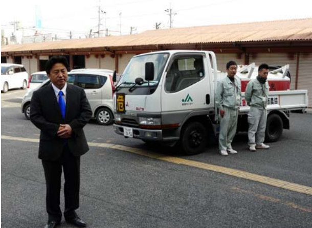
第10便 3月25日 (宮城県南三陸町)