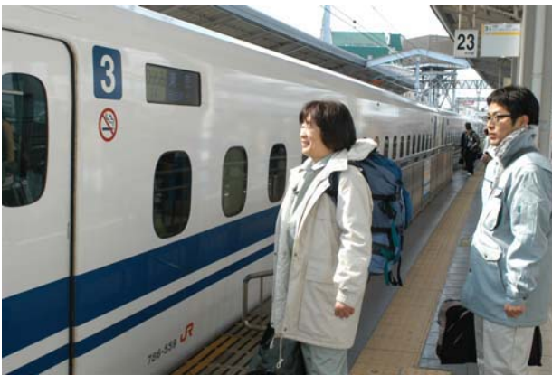
保健師 3月26日 (岩手県大船渡市)