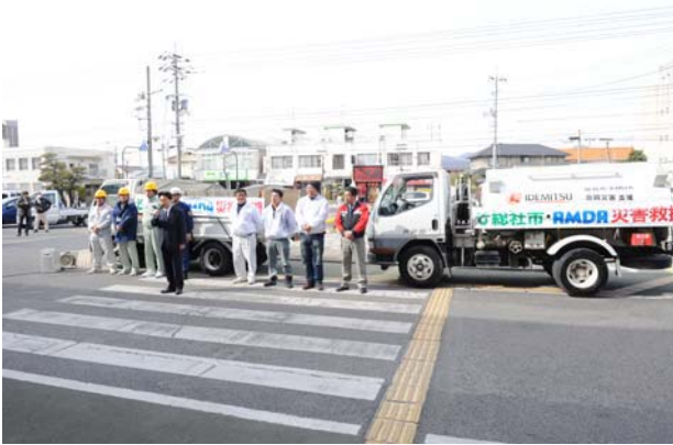
第3便 3月18日 (岩手県釜石市, 大槌町)