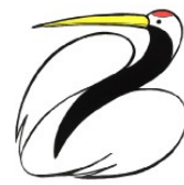
市の鳥 タンチョウ