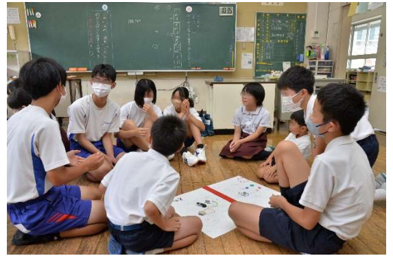
小学生・中学生のふれあい活動