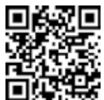
もうしこみ 申込フォーム

ある じてんしゃ の 歩く、自転車に乗る → ポイントをためて多くて 5000円の商品券をもらう！