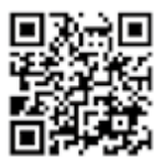
くせいちようどうが 国税庁動画 チャンネル

※ 外国人は2月14日～3月15日(8:30～17:00)、人権・まちづくり課で確定申告することができます。ポルトガル語、スペイン語、英語、中国語の通訳がいます。申告したい人は行く前に電話してください。