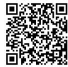
くせいちよう 国税庁LINE 公式アカウント