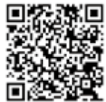
あるとく とく 歩得・リン得HP