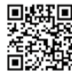
かくていしんこくしよとう 確定申告書等 作成コーナー

※ 自分でスマートフォンを使って確定申告をすることもできます。 右の「確定申告書等作成コーナー」をスキャンして申告書をつくりま す。e-Taxで送ります。詳しいことは、右の「国税庁動画チャンネル」を見てください。