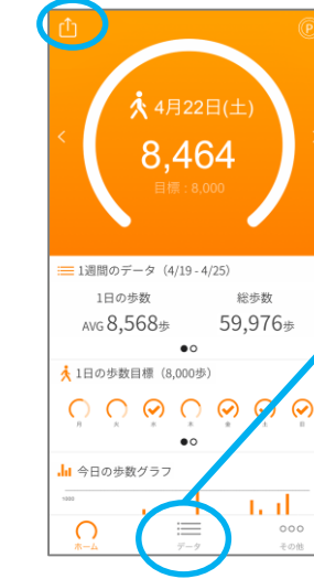
← [歩数計アプリホーム画面]

アプリ内で保持している歩数情報を登録（「からだカルテ」に同期）します。7日に最低1回はアプリを立ち上げ、実行する必要があります。