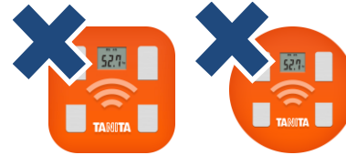
HealthPlanet（ヘルスプラネット）

間違っても「HealthPlanet（ヘルスプラネット）」をダウンロードしないようにしてください。