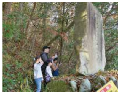
石碑に刻まれたヒントを読み解く

12月11日、「阿曾とマップとレジャーウォーク」が阿曾地区で開催されました。参加した親子連れら約50人は、地元に残る史跡や建造物などを散策。地図を手にクイズを解きながら、地域の宝探しを楽しんでいました。