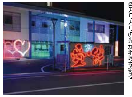
色とりどりの光が地域を彩る

12月2日、昭和公民館や下倉分館など、昭和地区内6カ所でイルミネーションフェスティバルが始まり、趣向を凝らしたイルミネーションが明るく彩っています。実施期間は地区ごとに異なり、2月上旬まで点灯します。