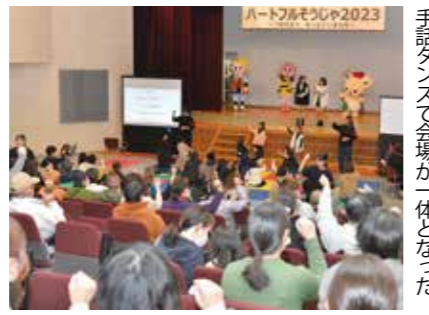
手話ダンスで会場が一体となった

12月2日、障がい福祉フォーラムが山手公民館で開催されました。手話ダンスユニット・DUMBOのライブパフォーマンスやマルシェなどが催され、約500人の参加者は、障がいのある人への理解を深めていました。