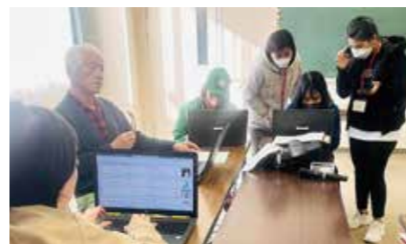
避難所に設置されるピクトグラムの説明書きを、参加者それぞれの母国語に書き換える

11 月26日に開催された外国人防災リーダー養成研修に参加しました。私たちは、ベトナム出身で、総社に来て4年が経ちました。日本は災害が多い国ですが、生活する中で防災のことはあまり考えていませんでした。災害が発生したとき、どうすればいいかを勉強したいと思い、この研修に参加しました。午前中に勉強したのは、心肺蘇生の胸骨圧迫のやり方です。何回か練習することができますようにしました。実際に、胸骨圧迫をする勇氣はまだないですが、自信をもってできるよう、研修などで練習したいです。