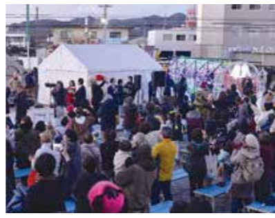
点灯式で市内が一斉に光に包まれた

12月2日、カミガツジプラザでイルミネーションフェスティバルが開催されました。来場者らはステージイベントや工作体験、ゲームコーナーなどを楽しんだり、街を彩る温かな光を眺めたりして、光の祭典を満喫していました。