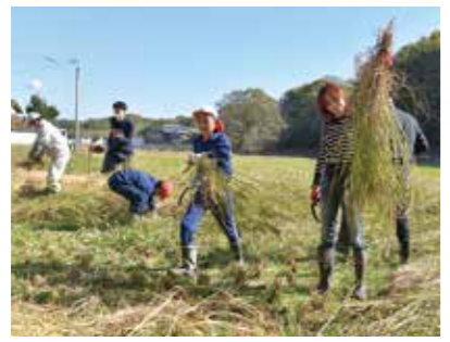
相川さんと一緒に刈り進める

11月14日、新本の本庄国司神社神田で本庄国司神社赤米保存会が赤米の稲刈りを行いました。新本小学校の児童と歌手で総社赤米大使の相川七瀬さんが参加。児童は、自分の背丈ほどの稲を丁寧に刈り取っていました。