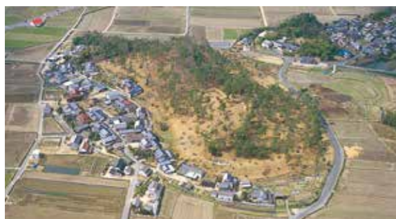
歴史ロマンあふれる作山古墳

議長 国の指定文化財であ り、全国10位の大きさを 誇る古墳に、いったい誰 が眠っているのか。当時 の政治の中心であった近 畿地方の勢力とどのよう