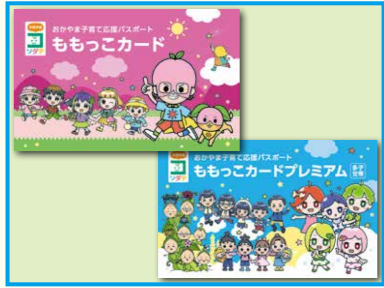
ももっこカードの新デザイン

1月から岡山県が発行している、「ももっこカード」のアプリ版が登場します。スマートフォンでのカード表示、協賛店検索、地域や年齢に合わせた通知などが可能になり、より便利に利用できるようになります。また、対象となる子どもの年齢が、18歳未満に拡大されます。そのほか、人気グッズが当たるキャンペーンなども実施予定です。