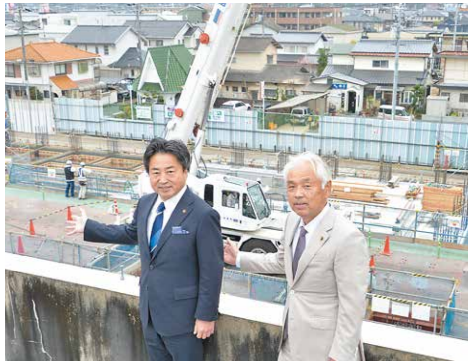
現在の市役所本庁舎屋上から見下ろす新庁舎の建設現場

置いた建設を進め、令和7年1月の完成を目指しています。1階は市民の利便性を重要視。デジタルを駆使して、来庁者が可能な限り移動することなく、手続きを終えられようレイアウトを考