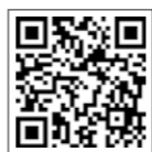
申込二次元コード

参加を希望する人は、申込二次元コードを読み取って申し込むか、下の参加申込書にご記入の上、当日会場までご持参ください。