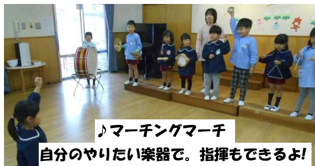
♪マーチングマーチ