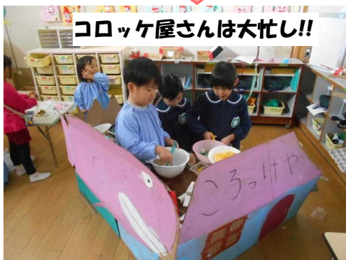
コロッケ屋さんは大忙し!!

劇遊びで作った大道具のコロッケ屋さんと気球を合体させて、保育室にコロッケ屋さんがオープン。コロッケだけでなく、焼きそばやラーメン、飲み物もあり、お客さんに注文を聞くと、厨房でせっせと料理を作り、テーブルまで運んでくれます。劇遊びは、まだまだ進化しながら続いていきそうです。