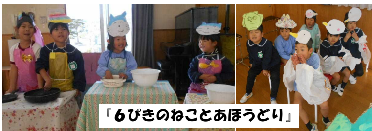
「6びきのねことあほうどり」

発表会で大勢のお客さんに、劇遊びや歌、楽器遊びなどを披露した子どもたち。練習のときと同じように、本番でも元気いっぱい演じたり、歌ったりすることができました。当日は10人での発表でしたが、少人数を感じさせないパワーが伝わってきました。終始、温かい眼差しで子どもたちを見守り、大きな拍手をたくさんくださった皆様に、心より感謝申し上げます。また、保護者の皆様からは心温まるご感想をお寄せいただき、ありがとうございました。発表会は終わりましたが、その後も劇遊びや楽器遊びは続き、そしてまた別の遊びに繋がっていています。子どもたちの発想力ってすごいなと感心させられています。