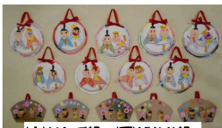
(上)いちご組・(下)ばなな組