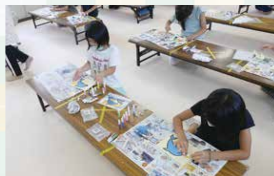
みんなで制作に取り組んだよ

クラブでは、子どもたちが安心して笑顔で過ごせるよう、家庭的な雰囲気を感じられる居場所づくりに努めています。また、子どもたちが自立することを目標として、自ら考えて遊んだり、勉強したりできるよう支援員がサポートしています。