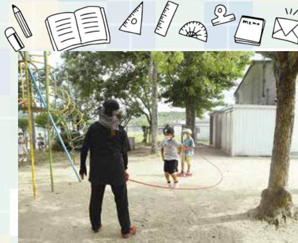
最高記録を目指して、何回跳べるかな

総社東小学校の1から3年生までの49人が在籍する総社東キッズクラブ。学年の違う子どもたちが、放課後や長期休みの時間を宿題をしたり、外で遊んだりして仲良く過ごしています。