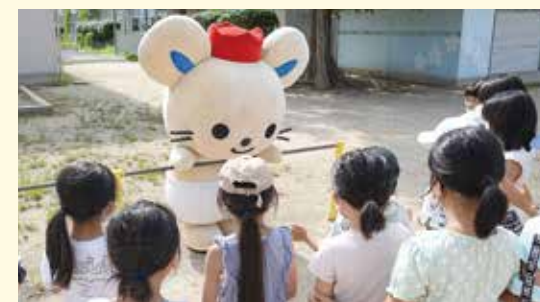
回れるようになりたいな

総社東キッズクラブに遊びに行ってきたよ。 校庭で、みんなで追いかけて遊んだね。鉄棒に挑戦したけどできなかったんだ。でも、みんなが応援してくれてうれしかったよ。運動の後は、みんなが育てているカブトムシや作った砂絵を見せてくれてありがとう。 とても暑かったけど、明るくて元気いっぱいみんなと遊べて楽しかったよ。また一緒に遊ぼうね。