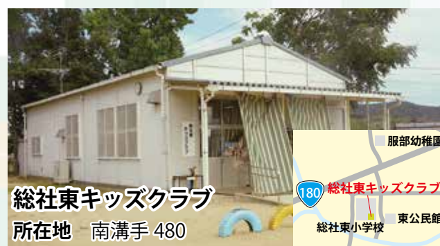
総社東キッズクラブ 所在地 南溝手 480