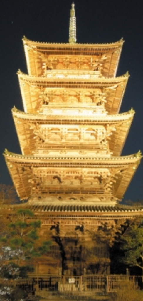
備中国分寺五重塔ライトアップ