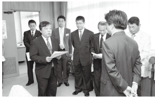
タクシー事業者による市長への陳情

などが示されている。市長は「市民本意で考え、柔軟に対応したい。来年4月からの実施で、売り上げ減の穴埋めをする制度を作る」と答えた。タクシー事業者の5社によると、「それぞれの会社によって異なるが、前年比で売り上げが1割から2割減った」とされている。