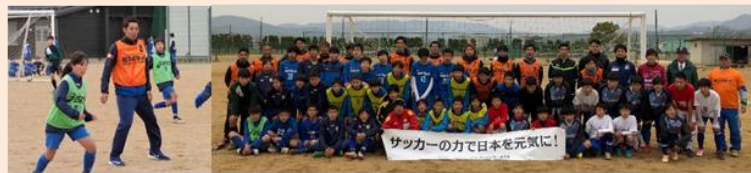
<Jリーガー復興支援> チャリティーサッカー2019 ふれあい活動 in 岡山