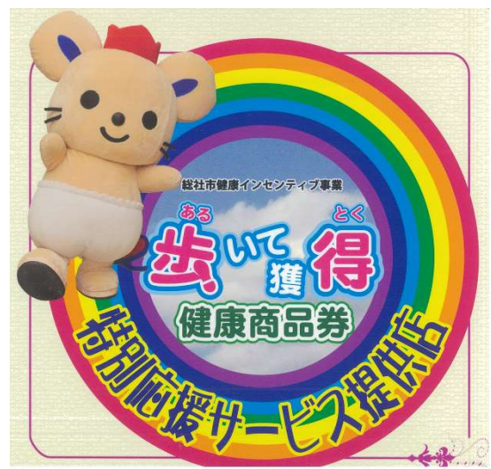
【特別応援サービス提供店】