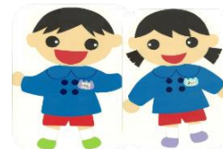
げんきいっぱいげんくん にこにこあいさつあいちゃん