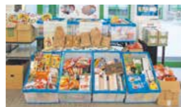
市役所に集まった食料品

市では、家庭や事業所で余った食材を生活困窮世帯などに無償で提供するフードドライブ活動に取り組んでいます。