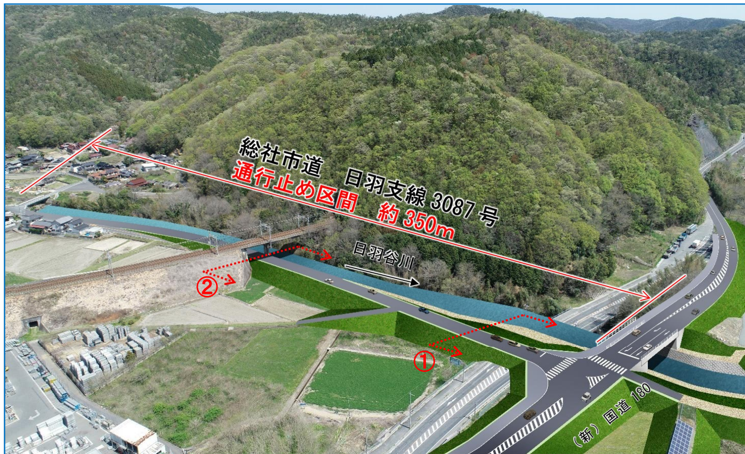
対策工事（堤防整備）イメージ

平成 30 年 7 月豪雨と同程度の出水で、河川の水が溢れないように堤防整備を行います。