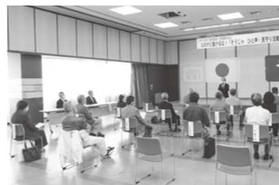
昨年5月に行われた見守り活動出発式の様子

5月12日は、民生委員・児童委員の日です。大正6年5月12日、岡山県で民生委員・児童委員制度の起源である済世顧問制度設置規程が公布されたことに由来するもので、全国民生委員児童委員連合会が設定。活動を多くの人に知ってもらうとともに、委員らの意識を高めることを目的としています。私たちの役割は、皆さんが住み慣れた場所で安心して暮らせるように支えることです。地域の特性に応じた見守りや交流の場づくりといった活動に、取り組んでいます。 昨年の5月12日には、高齢者などの見守り活動の出発式を開催。164人の委員の代表として各地区の会長が、活動の原点である声掛けや見守りに尽力することを改めて確認しました。今年も、民生委員・児童委員の日に合わせて総社独自の取り組みを行うことを計画しています。 困りごとがある際には、お住まいの地域の民生委員・児童委員に気軽に相談ください。 (総社市民生委員・児童委員協議会)