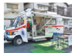
保冷库や発電機、ソーラーパネルを備えた緊急時薬局車両