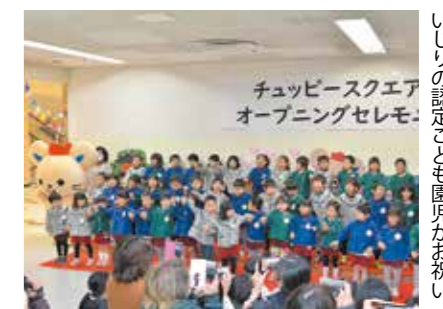
いじりの認定こども園児がお祝い

2月20日、天満屋ハッピータウンリブ総社店2階にチュッピースクエアがオープンしました。打ち合わせや休憩に使えるフリースペースで、定期的にイベントを開催予定。チュッピーのPRや市民の憩いの場として活用します。