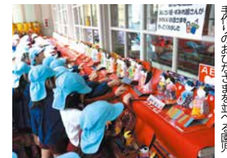
手作りのおひなさまを並べる園児

2月15日から、まちかど郷土館で寄贈されたひな人形の展示が始まりました。総社幼稚園5歳児約50人が手作りしたひな人形も、28日まで展示。来館者はひな人形を見て、一足早い春の訪れを感じていました。