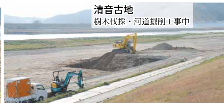
清音古地 樹木伐採・河道掘削工事中