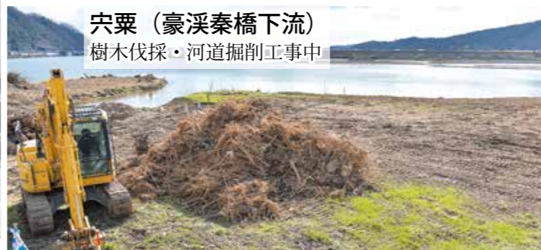
宍粟 (豪溪秦橋下流) 樹木伐採・河道掘削工事中