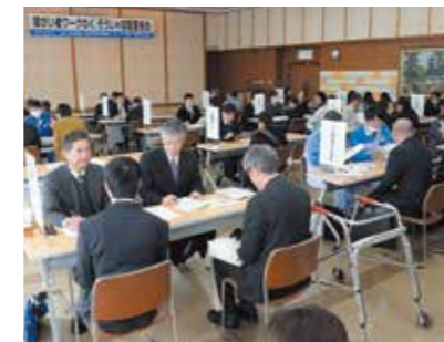
熱心に話を聞く求職者

障がい者の自立・就労支援を目的に、障がい者ワークわくそうじゃ就職面接会が1月29日、総合福祉センターで開かれました。17の企業・事業所が参加。求職者との個別面接や就職相談が行われました。