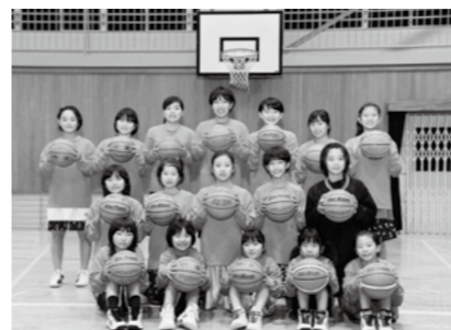
全国大会に臨むメンバー

私 たち総社ミニバスケットボール教室の女子チームは、3月末に東京で開かれる全国大会への切符を手に入れることができました。ずっと目標にしていた舞台に初めて立てることがとてもうれしです。 チームのメンバーは小学生17人で、週に4回練習しています。通う小学校はみんなばらばらですが、仲良く活動しています。チームの強みは粘り強いディフェンス力。練習中から、頭を使ってプレーすることを心掛けています。一人ひとりが次の一手を考えながら動くことが、チームの勝利につながっていると思います。