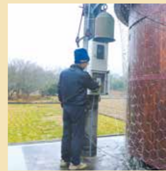
サイレンのテストを行う

災害時などに危険を知らせる地区緊急用サイレンを市内5カ所(右図のとおり)に設置。1月26日から2月9日にかけて、地区の代表者と市職員が音や操作方法の確認などを行いました。