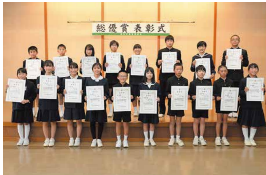
表彰された市内小中学校の児童生徒