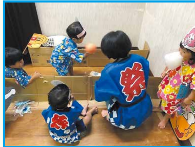
総社地区の親子クラブでは、9月に夏祭りをして楽しんだ

「子どもを、同じくらいの年齢の子と遊ばせたい」、「小学校に入学する前に地域で知り合いを作りたい」という人は、親子クラブに参加してみませんか。