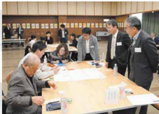
意見を出し合うワークショップ参加者

現在の市役所庁舎は昭和44年に竣工し、耐震性能の不足や老朽化などさまざまな課題があるため、新庁舎の建設を計画しています。1月25日、建設に向けて市民の意見を取り入れるため、ワークショップを開催。市内団体からの推薦者や有識者、地域住民、学生など20人が参加し、市についての意見を出し合いました。今後のワークショップでは、現庁舎見学や新庁舎へのアイデアを出し合うグループワークを予定。出た意見などを参考にし、建設計画を進めていきます。