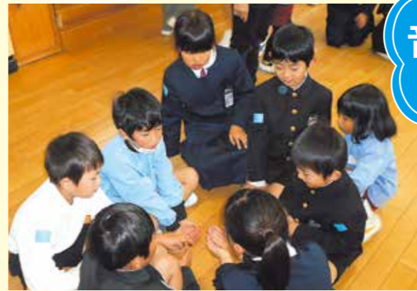
新本小のお兄さんお姉さんと英語を使った遊びで交流