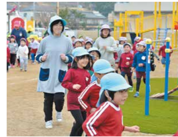
完成した園庭でマラソンをする園児ら

園庭は、隣接していた旧総社保育所園舎の解体跡地に整備。面積は約1200㎡、事業費は約6300万円です。