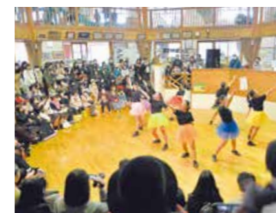
総社南高校ダンス部のステージ

2月9日、ウインターフェスティバルがきよね夢てらすで開催され、ダンスチームなどが熱いパフォーマンスでステージを盛り上げました。子どもの外遊び企画や屋台もあり、来場者は冬の祭典を楽しんでいました。