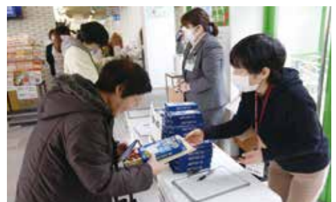
2月5日から7日まで、市役所支所でマスクを配布した

また、全国的にマスクが品薄になっている事態を受けて2月5日、市が防災用に備蓄していたマスクを無料配布。市内のコミュニティ地域づくり協議会や学校、福祉施設などの代表を通じて各地区や施設に届けられたほか、市役所を訪れた市民にも配られました。