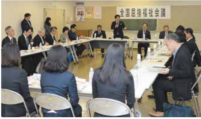
各分会の関係者や市の幹部らが集まった全国屈指福祉会議

た「福祉王国プログラム2020」を発表。住民一人ひとりに寄り添った支援を実現するため、地域との連携を強化する方針が示されたほか、各分会から重点的に取り組む施策について報告がありました。