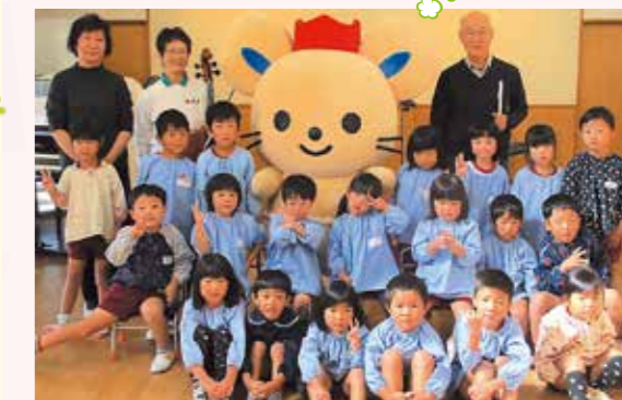
すてきな演奏に楽器体験。楽しい音楽会だったね