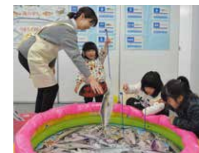
釣った魚の種類は何かな

1月24日から30日までの学校給食週間に先立ち、18日に地食べ学校給食センターえがおで学校給食を知っ展11を開催。来場者は豆つかみや魚釣りゲーム、パネル展示の見学などを行い、給食や食育への理解を深めていました。