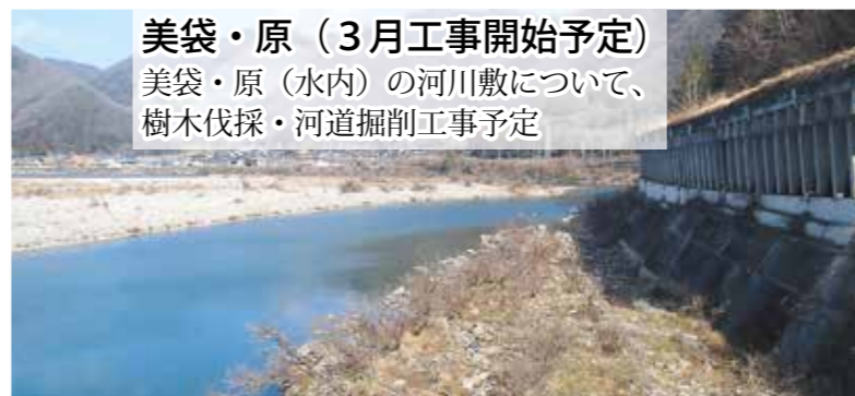
美袋・原 (3月工事開始予定) 美袋・原 (水内) の河川敷について、 樹木伐採・河道掘削工事予定