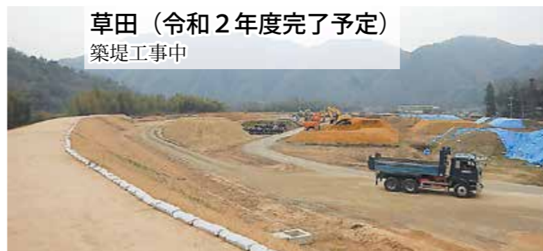
草田 (令和2年度完了予定) 築堤工事中