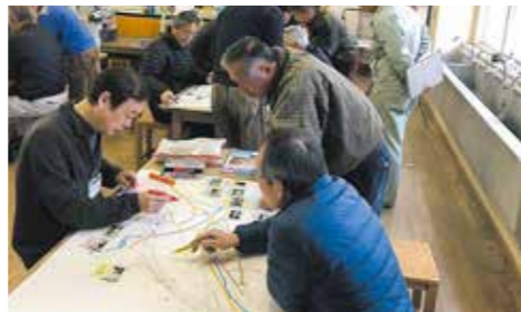
現地で確認した情報をマップに反映させる

1月18日、地域の防災力を高める活動の一環として、見延・宍粟地区で防災マップ作成ワークショップが開催されました。