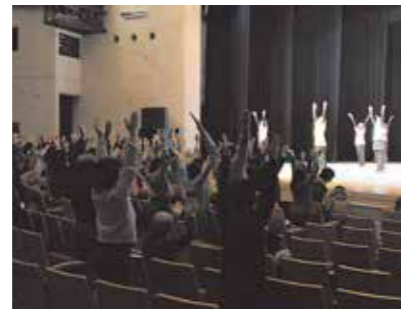
観客と一緒にヨガ

2月2日に市民会館で働く婦人の家まつりが開催され、約800人が来場しました。ステージでは大正琴や3B体操などの講座生が日ごろの練習の成果を披露。ロビーでは絵手紙やボトルフラワーなどの展示が行われました。