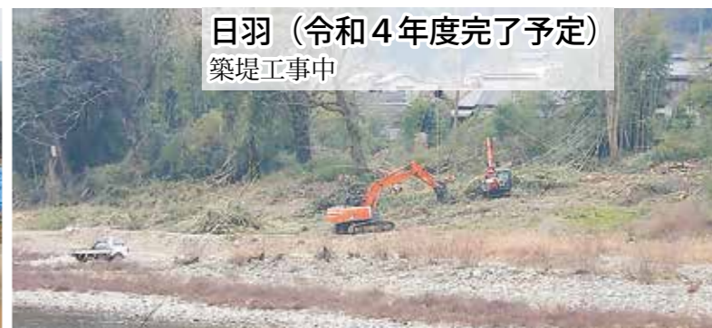
日羽 (令和4年度完了予定) 築堤工事中