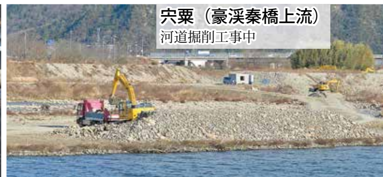
宍粟 (豪溪秦橋上流) 河道掘削工事中