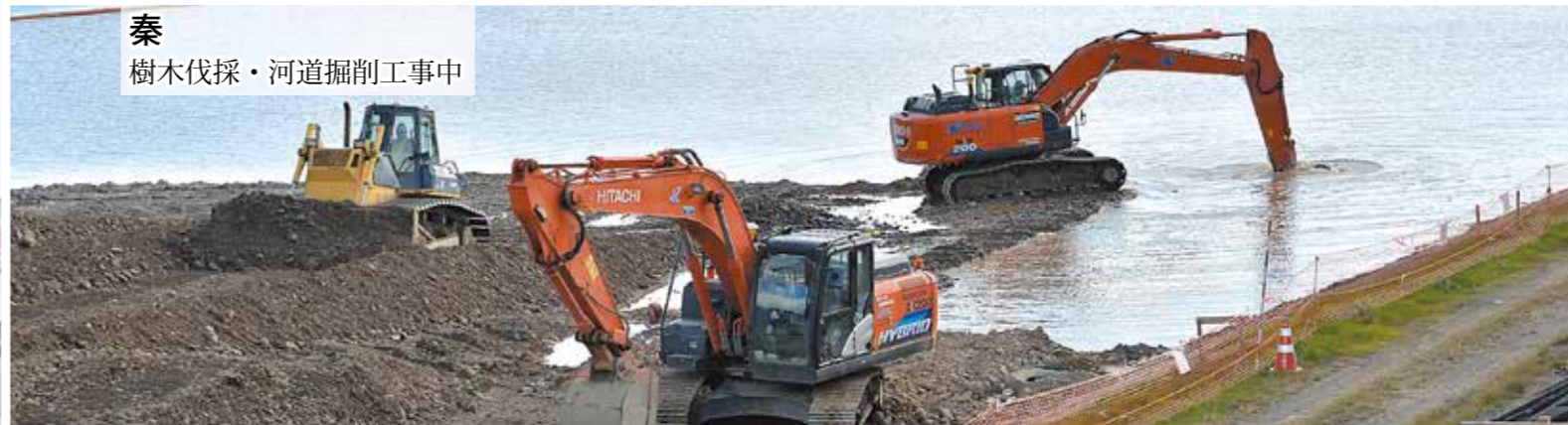
秦 樹木伐採・河道掘削工事中

西日本豪雨を踏まえ、洪水被害を最小限にするため、高梁川で堤防や河川の工事などが行われています。市内各地で整備を進め、水害から住民を守ります。