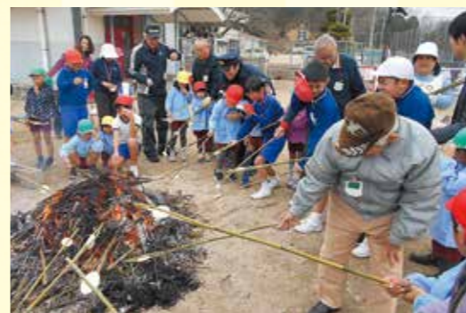
地域の人や小学生と一緒にとんど焼き