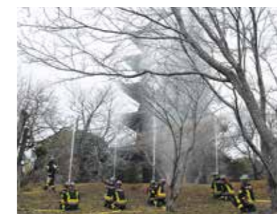
五重塔へ向けて放水

1月26日の文化財防火デーを前に22日、消防訓練が備中国分寺で行われました。五重塔北西の山林から出火したと想定。参加した消防署員や関係者ら約40人が連携し、消火活動の手順を確認していました。