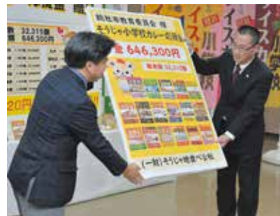
目録を受け取る池田小学校長

2月3日、総合福祉センターでそうじゃ小学校カレー応援金贈呈式が行われました。市内の小学校や地域の関係者ら約40人が出席。昨年の売り上げ個数3万2315個に対して、1個当たり20円の応援金を各校園へ贈呈しました。