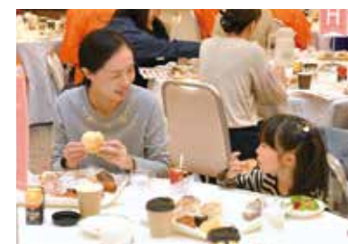
嘉門タツオさんのライブで盛り上がる(写真上)。パンの食べ比べをする参加者(写真左)