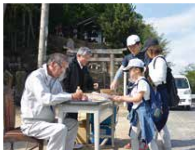
ポイントでスタンプをゲット

10月27日、茶臼嶽古墳など秦の史跡を巡る秦の郷スタンプラリーがサンピア岡山総社を発着点に開催されました。市内外から約500人が参加。チェックポイントを回ってスタンプを集め、記念品を手にしていました。