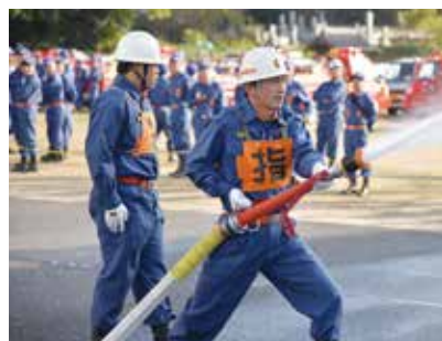
標的に向けて放水

消防団実戦放水訓練大会が10月27日、市消防署で行われました。市内18分団から消防団員352人が参加。模擬の火元に放水する時間と技術を競い合いました。優勝は日美分団、準優勝は山田分団でした。