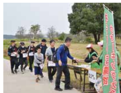
無事にチェックポイントを通過

山手公民館を発着点に11月3日、そうじゃ吉備路ウォーキング大会が開催されました。備中国分寺や造山古墳などを巡る4コースに、市内外から600人超が参加。秋の景色を楽しみながら歩いていました。