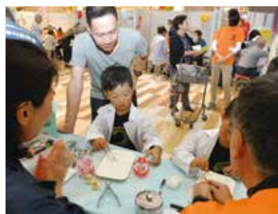
ホワイトニングを体験

10月20日、天満屋ハッピータウンリブ総社店で、吉備路お口の健康まつりが開催されました。虫歯のできやすさチェックや歯科医師体験などを通して、訪れた親子連れらは歯の大切さを改めて学びました。