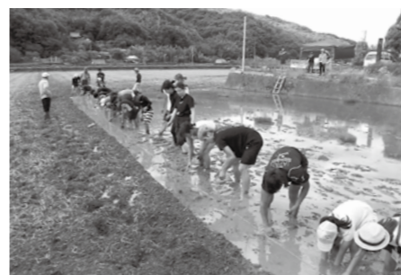
クラブメンバーで田植え

10月14日(祝)の午前9時から行う市民総合スポーツ祭の参加者を募集します。 参加資格・種目・場所・内容 左 の表のとおり 参加費 1人200円(傷害保険料を含む)。「ニュースポーツにチャレンジ」は無料で、当日きびジアリーナ前にて受け付け 申込方法 市スポーツ協会の事務所(市スポーツセンターのサブアリーナ南側)に備え付けの用紙に、住所、氏名、生年月日、電話番号、参加費などを記入し、参加費を添えて申し込む。電話やファクシミリなどでの申し込みはできません 申込期間 9月15日(日)から30日(月)まで(土・日曜日、祝日も可)。受付時間は、午前9時から午後4時まで 問い合わせ 市スポーツ協会事務局 (☎0226)