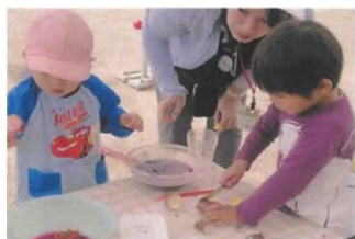
Kỹ năng sống được nuôi dưỡng trong mỗi lần trẻ suy nghĩ và làm thử.