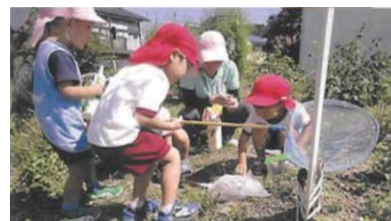
Nuôi dưỡng tính hiếu kỳ về tri thức, niềm vui khi phát hiện ra được điều mới trong việc bắt côn trùng.

Cuộc sống trong Yochien (trường mầm non), Hoikuen (Nhà trẻ), Nintei Kodomo En (vườn trẻ nhận định) trang bị cho trẻ nhiều kỹ năng trong quá trình vui chơi vận động tâm và thân.