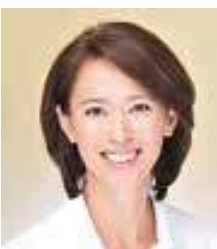
原马拉松选手 有森裕子