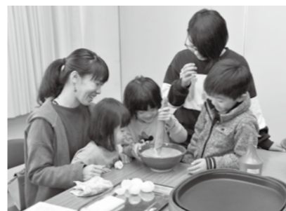
自然薯のクレープ作り

12月15日に、総合福祉センターで「好きなことをみつける日」を開催しました。最近増加しているうつ症状を予防する一つの手段として、五感から良い刺激を感じてもらおうと、6つの体験ブースを設けました。 ドローンブースでは小型ドローンの操縦、音楽ブースでは、音の苦手な人が、ヘッドフォンを装着してギターに挑戦したり、スタックと音を合わせたりしました。ハンドメイドは、松ぼっくりで作ったトトロで自分だけの小さな森づくりと、つまみ細工・レジンアクリルなど。料理体験では、自然薯のクレープ作