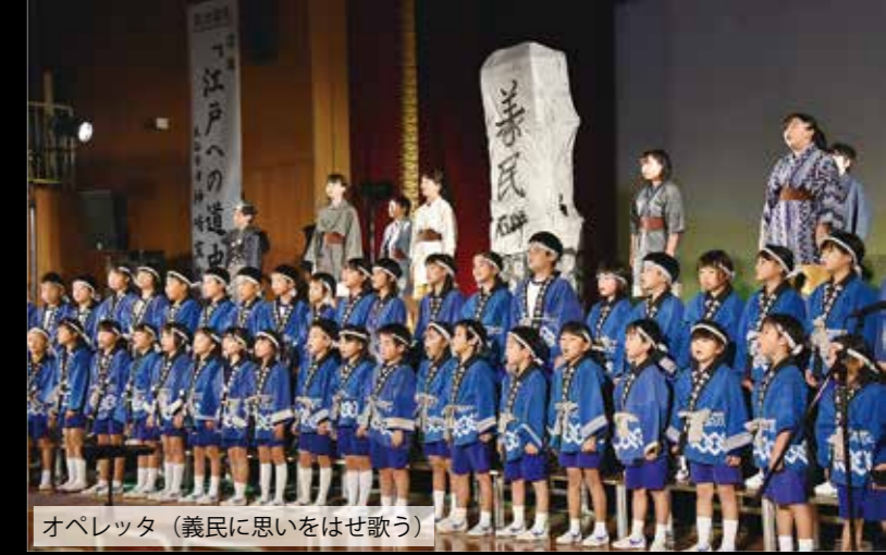
オペレッタ (義民に思いをはせ歌う)