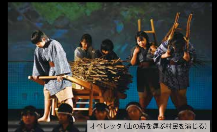
オペレッタ (山の薪を運ぶ村民を演じる)

江戸時代の中ごろ、新庄村と本庄村の村民4人が岡田藩から村の山を守るために直訴し、その引き換えとして処刑された新本義民。今年は義挙から300年です。