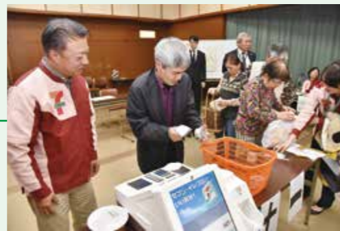
レジ打ち、商品の袋詰めを体験する参加者