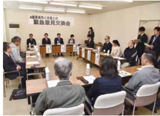
A型事業所の代表者から経営状況などを聞く

これを受け4月17日、運営状況や制度運用の課題を把握するため、市内のA型事業所の代表者を集めた緊急意見交換会が市役所で開催されました。