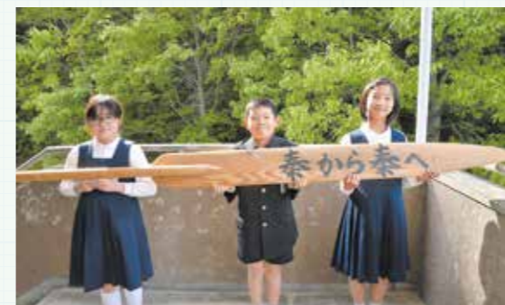
卒業生から引き継がれる権

卒業生を送る会で、新6年生へ毎年引き継がれている、「秦から秦へ」の文字が書かれた権。6年生が小学校の舵をとる、という意味が込められています。代々受け継がれてきた権を受け取った新6年生は、最高学年の自覚と責任をもち、毎日下級生の世話や声掛けをして、秦小を引っ張っています。