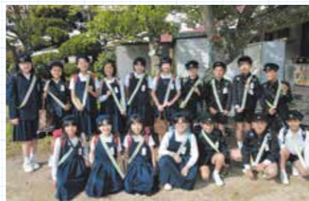
タスキを掛ける通学班長たち