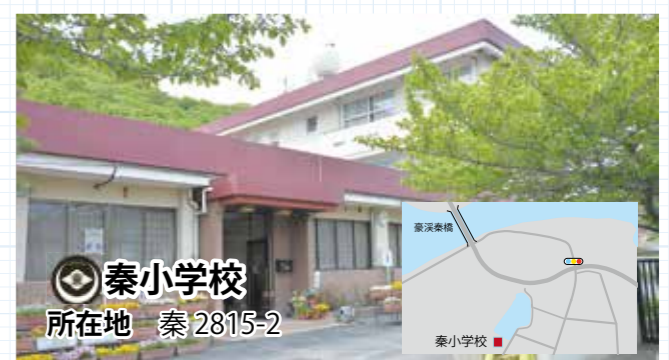
秦小学校 所在地 秦 2815-2

備中国分寺周辺にランニングコースが完成しました。吉備路の風景を堪能しながら健康づくりに取り組んでみてはいかがでしょうか。