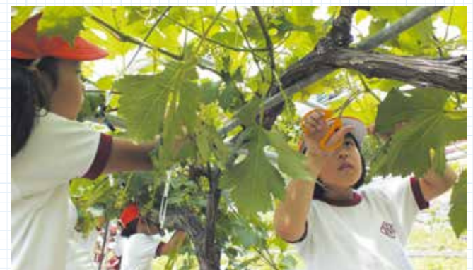
秦地区名産のマスカットを作る

6学年の縦割り班で競走する秦っ子リレーや、通学班の歴代班長の名前を書いて引き継ぐタスキなど、伝統的な行事を大切にしています。学年を超えた交流も多く、自然とリーダーシップや団結力が身に付きます。学校全体が一つの家族のように仲良しなのが魅力です。