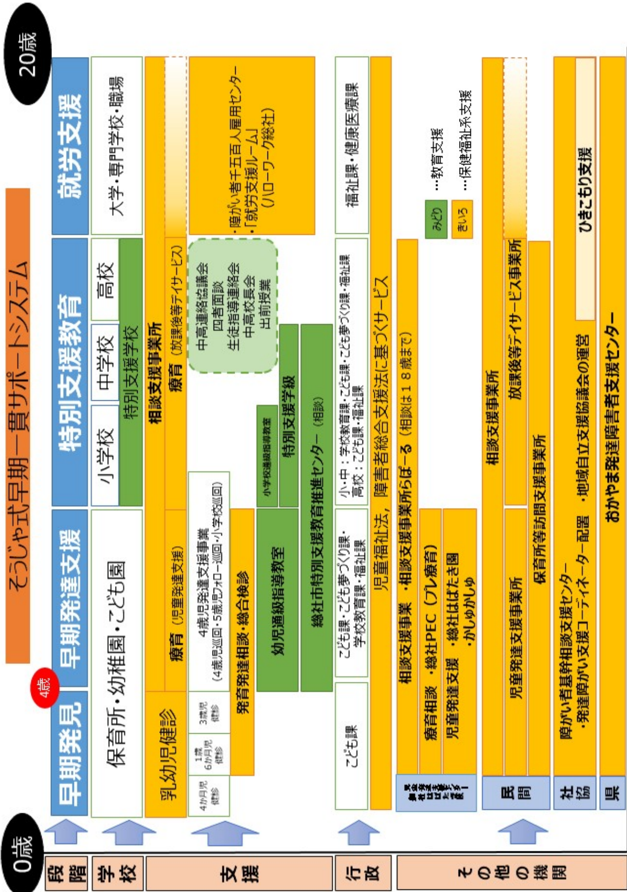
図表 17 そうじや式早期一貫サポートシステム