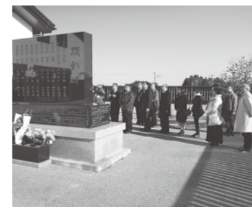
顕彰碑前で被災者を悼む

□脳トレゲームをしました。ちよつとドキドキしましたが、笑いあり、拍手ありの楽しい時間でした。久しぶりに頭の体操になったと、好評でした。ゲームの中で交通状況など分かりやすく説明してもらい、勉強になりました。 講師の人は、寸劇の説明も楽しく内容も分かりやすく、大変上手でした。ありがとうございました。また機会があれば、利用させてもらいたいと思います。 (北国府サロン生) 11月27日・28日の2日間、福島県相馬市での防災視察研修に参加しました。被災地復興状況視察や地元消防団、自主防災組織との意見交換を通じて、相馬市の被災者の防災意識の高さを痛感しました。 ある地区の自主防災自衛団は震災前から、自分たちで考え、自主的に防災訓練を行っていました。結果、その地区の人は、命を落とすことなく避難できたと言