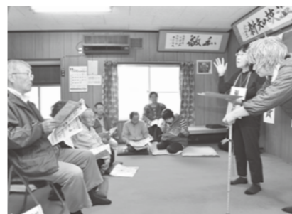
寸劇で詐欺の手口を理解する

北国府サロンで要望が強く、消費生活講座と交通安全教室が、11月30日に開催されました。講座は、申請書を提出するだけで簡単に申し込めるのが、何より良かった。消費生活講座では、だましの手口を面白おかしく寸劇で紹介してもらい、とても分かりやすく大変参考になりました。何かおかしい！詐欺ではないかと思ったら、勇気を出して言えるように、声を出して「要りません」「必要ありません」「断ります」と練習しました。また、怪しいと思ったら、必ず誰かに相談できれどと思えます。 交通安全教室では、○△