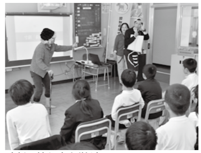
寸劇で接し方を学ぶ

10月31日の5校時目に、地域包括支援センターの職員による認知症サポーター養成講座が行われ、池田小学校4年生11人が受講しました。 児童は、国語科や総合的な学習で、生活の中でのバリアフリーについて学んでおり、みんな興味をもってこの講座に臨みました。 まずは、スライドで「認知症とはどのようなことか」を学びました。時々、クイズを交えての説明でしたが、「知ってる。聞いたことある!!」などの声も上がっていました。 地域包括支援センターの職員による寸劇では「物忘れをしている人への接し