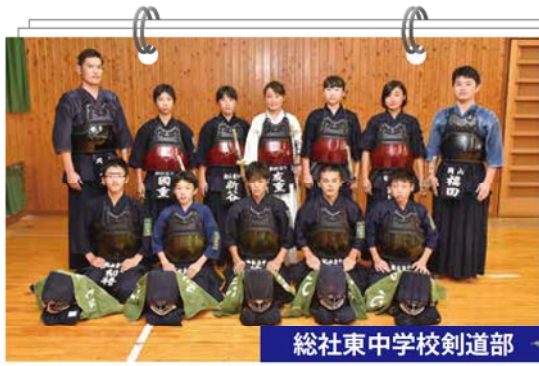
総社東中学校剣道部