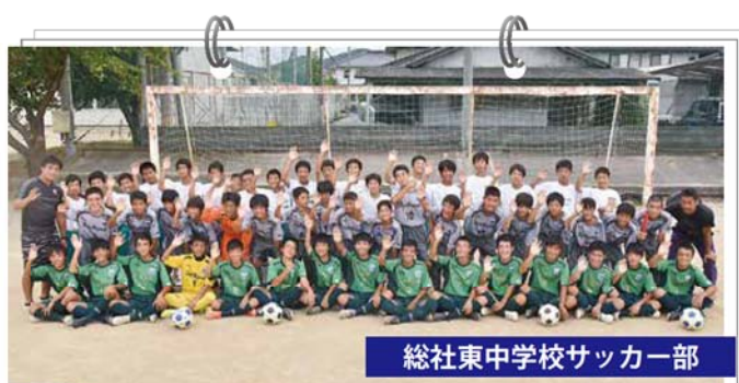
総社東中学校サッカー部