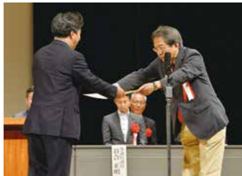
厚生労働省職業安定局長から障がい者雇用に尽力したとして、市長に感謝状が贈られた