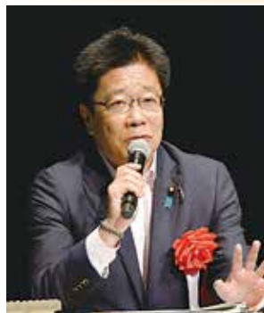
一億総活躍・働き方改革担当 加藤 勝信 大臣

従業員数が50人以上の企業で障がい者を雇っていない企業が日本全体で約3割ある。受け入れてくれる環境をつくっていききたい。総社市が千人雇用事業で培ったノウハウを全国に広げてほしい。