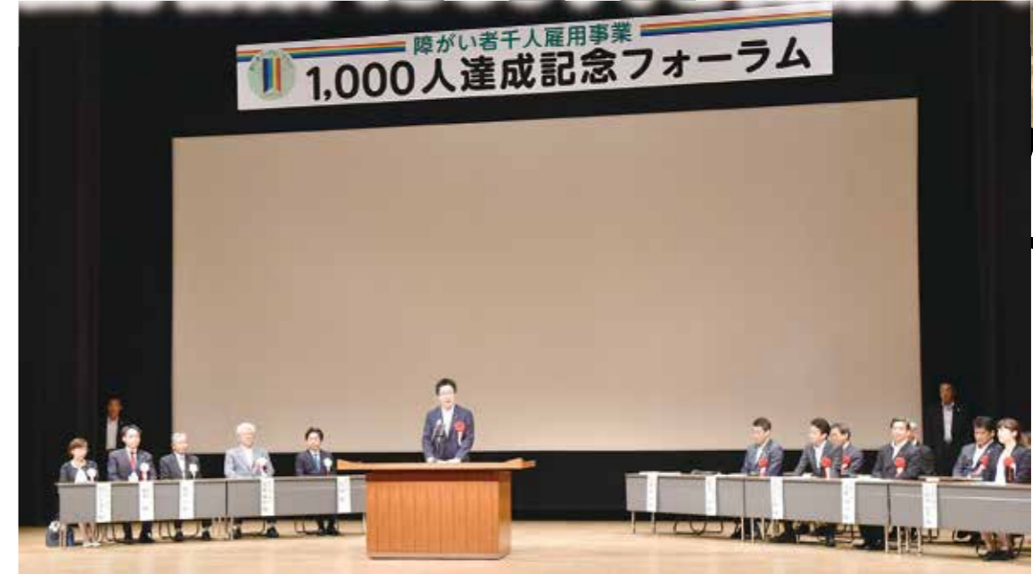
1000人達成を記念し、開催された記念フォーラム。多数の関係者からお祝いの言葉が贈られた