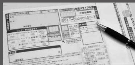
家電リサイクル券